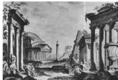
T. Kościuszk o, Ruiny starożytnego Rzymu , rysunek wykonany z wyobraźni podczas studiów w Paryżu w l. 1769—1774